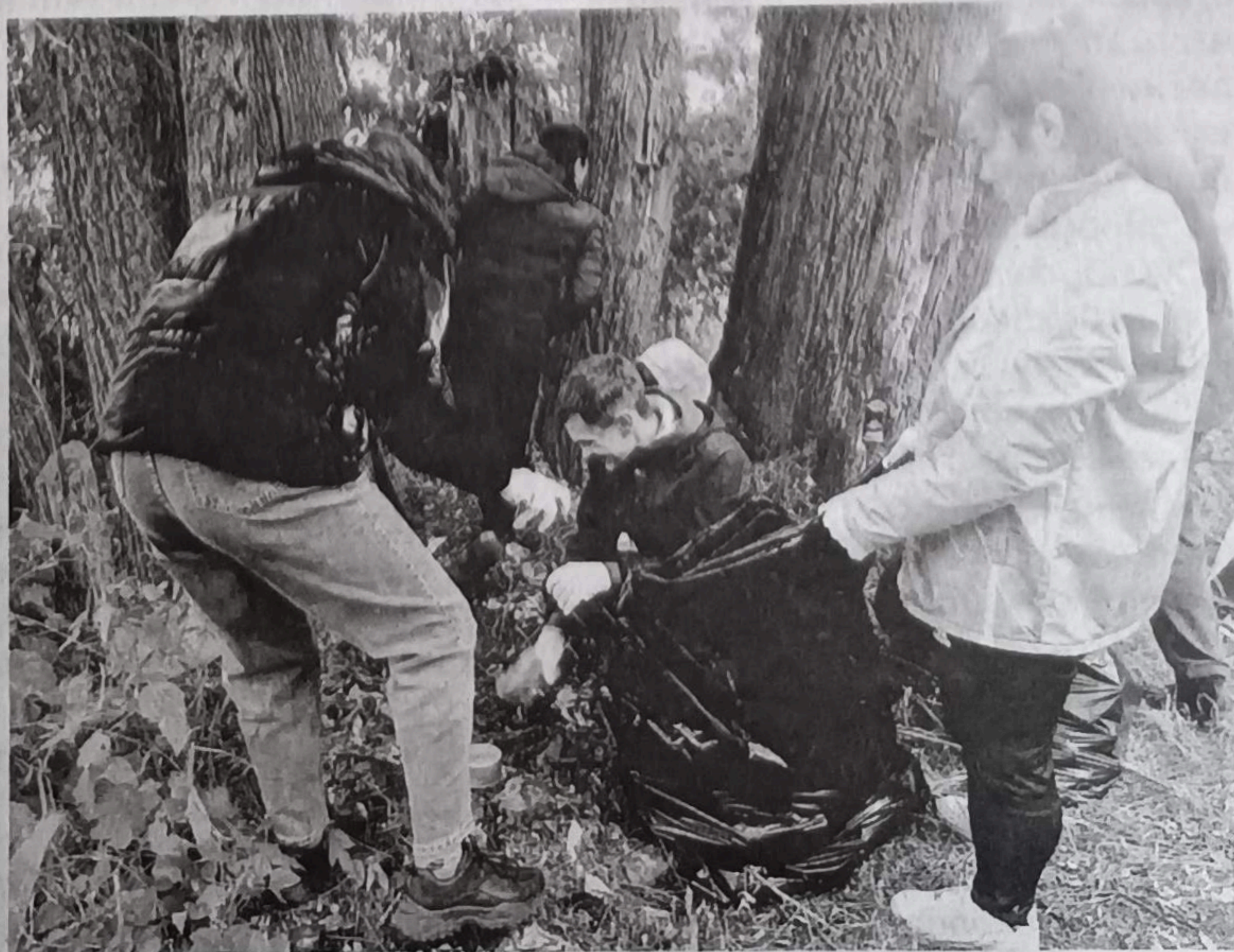
Ребята потрудились на славу и нужно чтобы их труд не пропал даром.